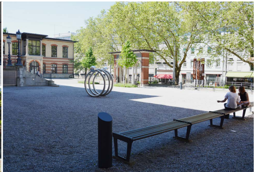
Oben: CAB Kiesplatz links Rampe